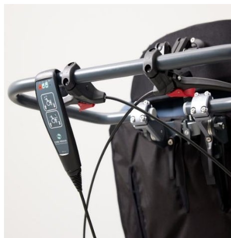
Skubbebøjlen monteres på beslagene, hvor fingerskruerne ses i siderne.

Bremsegrebene er monteret på skubbebøjlen. Grebene er udstyret med en lås, som kan låses op ved at holde bremsegrebet inde, mens den røde udløserknop trykkes ind.