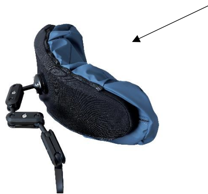
Armen på nakkestøtten består af udskiftelige, kraftige kugleled.

Der er påmonteret to pudeelementer på nakkestøtten, en blød skumbase betrukket med neopren og en blød pude med tre kamre fyldt med Krøyer-kugler og viskoelastisk skum. De enkelte kamre kan justeres efter behov.