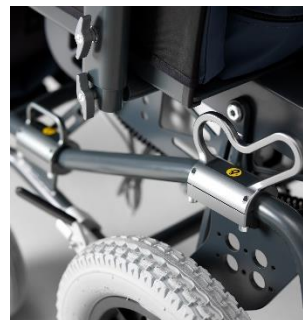
Transit Tie Down beslag (tilkøb)

Kørestolen spændes fast i køretøjet ved hjælp af fire Transit Tie Down beslag (tilkøb).