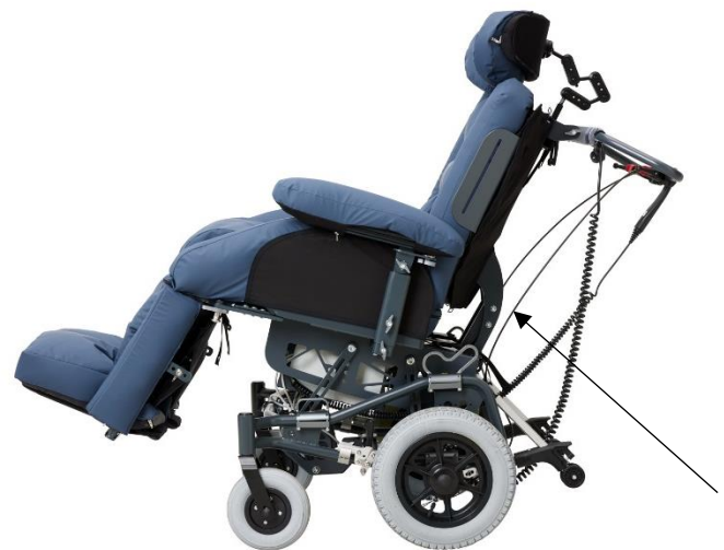
Konstruktionen på rygsystemet mindsker risikoen for shear ved ændring af ryg vinkel.

Rygforlænger (tilkøb) består af tre plader monteret på rygsystemet. Rygforlænger kan justeres asymmetrisk.