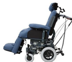
12½" massive hjul i gråt nylon gummi.

For mere information om Kamille Power Komfortstol kontakt Cobi Rehab på 7025 2522 eller cobi@cobi.dk .