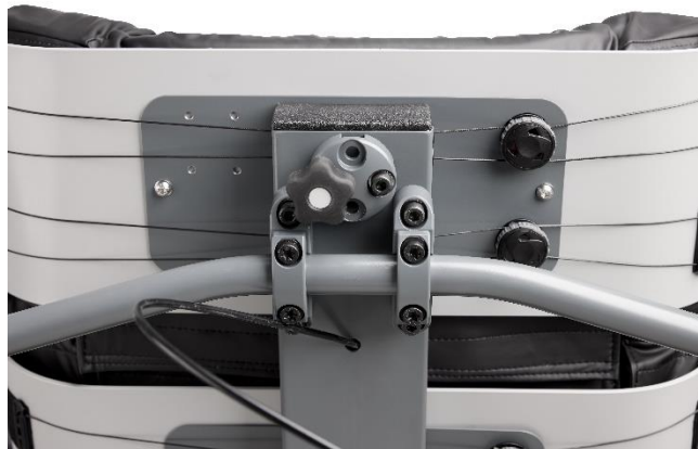
Et universelt nakkestøttebeslag tillader flere typer af nakkestøtter.

Under opladning kan kørestolens funktioner ikke bruges. Opladeren lader med 10A.