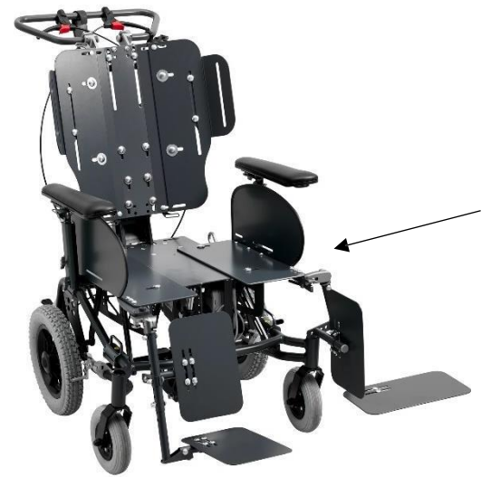
Unabhängige Platten im Sitzsystem sorgen für eine präzise Einstellung.

Im Gegensatz zu anderen Komfortrollstühlen ist die Größe nicht festgelegt, sondern innerhalb eines Bereichs einstellbar. Auf diese Weise können Breite und Tiefe so eingestellt werden, dass sie den Maßen des Benutzers optimal entsprechen.