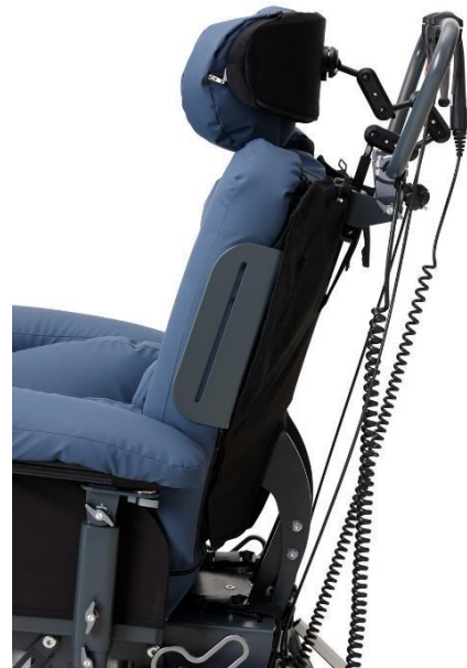
Der Schiebebügel des Kamille Komfortrollstuhls kann ganz nach oben geneigt werden, z. B. wenn der Rollstuhl in einen überfüllten Aufzug einsteigen und wieder aussteigen soll

⚠ Desinfizieren Sie den Kamille Komfortrollstuhl immer, wenn er an einen neuen Benutzer übergeben werden soll. Dies ist wichtig, um Kreuzkontaminationen zu vermeiden.