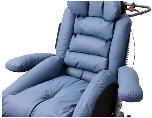
Die Armlehnen können in eine natürliche Ruheposition gebracht werden.

Flexarme mit Gewicht können optional erworben werden, um die Arme des Benutzers zu stützen und für zusätzliche Sicherheit, Ruhe und Komfort zu sorgen.