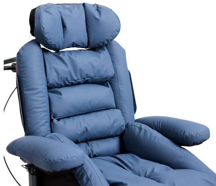
Die Kissen können modelliert und manuell für jeden Benutzer angepasst werden.

Die Kissen sind sorgfältig auf den zu stützenden Körperteil abgestimmt. Die Kissen sind in einem neutralen Ton gehalten, da die Erfahrung zeigt, dass dunkle Farben auf Benutzer mit visuellen kognitiven Funktionsstörungen „bodenlos“ wirken können.